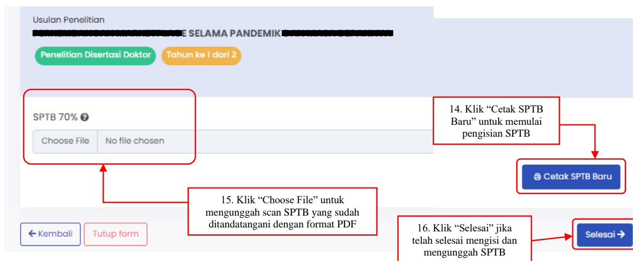
Gambar 6. Menu Surat Pertanggungjawaban Belanja 70%