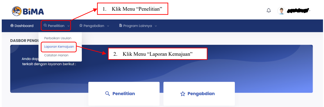
Gambar 1. Submenu Laporan Kemajuan

Pelaporan kemajuan penelitian dilakukan melalui BIMA dengan menggunakan user dan password yang sama yang telah dimiliki oleh dosen. Pilihan melaporkan kemajuan penelitian dapat diawali dengan memilih menu “Penelitian” dan submenu “Laporan Kemajuan” sebagaimana di ditampilkan pada Gambar 1.